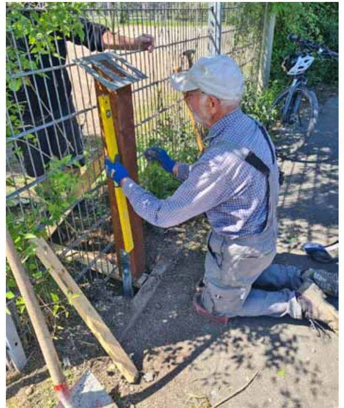
Mit handwerklichem Geschick werden die Stelen gesetzt und ausgerichtet.