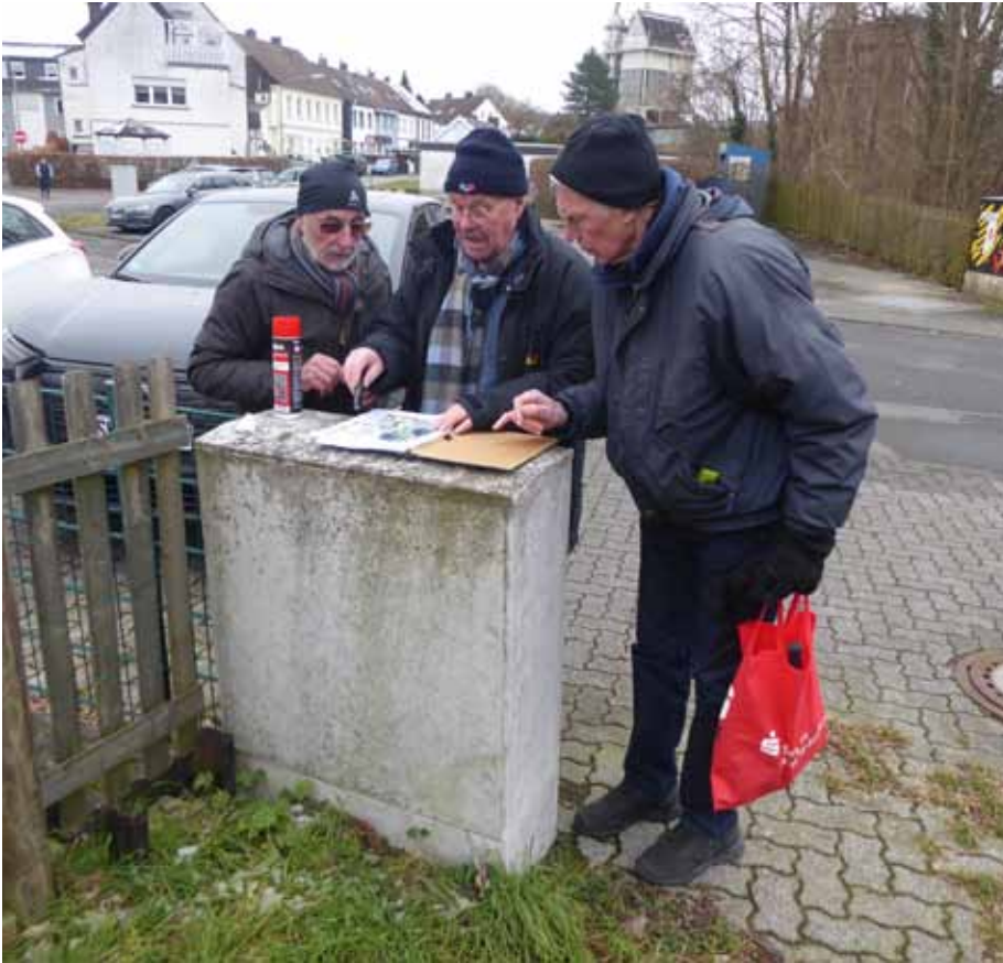
Das Planungsteam an Station 4 bei der Arbeit.

Vom Vereinsring wurde der Geschichtswerkstatt ein in der Nähe der Pfarrkirche vorhandener aber nicht mehr benutzter Schaukasten zur Verfügung gestellt. Dieser war in die Jahre gekommen und musste erst einmal auf Vordermann gebracht und gesäubert werden.