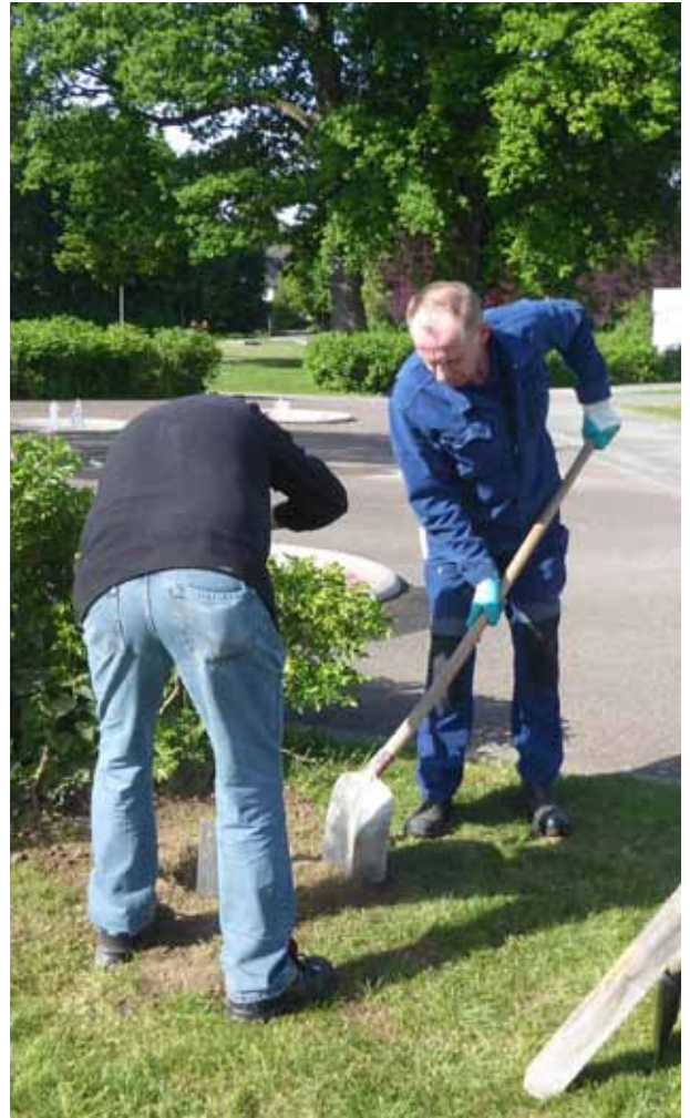
Einige Fundamentlöcher der Stelen mussten in Handschachtung ausgeführt werden.