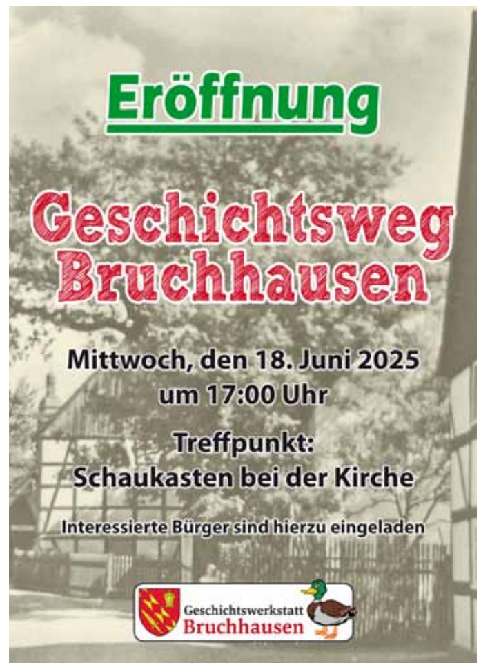
Plakat zur Eröffnung.