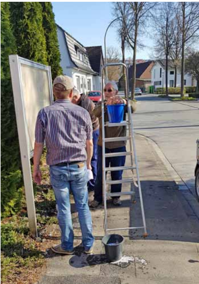
Aufbereitung des Schaukastens.

Das Warten auf die Genehmigungen der Grundstückseigentümer zur Errichtung der Stelen war letztendlich erfolgreich.