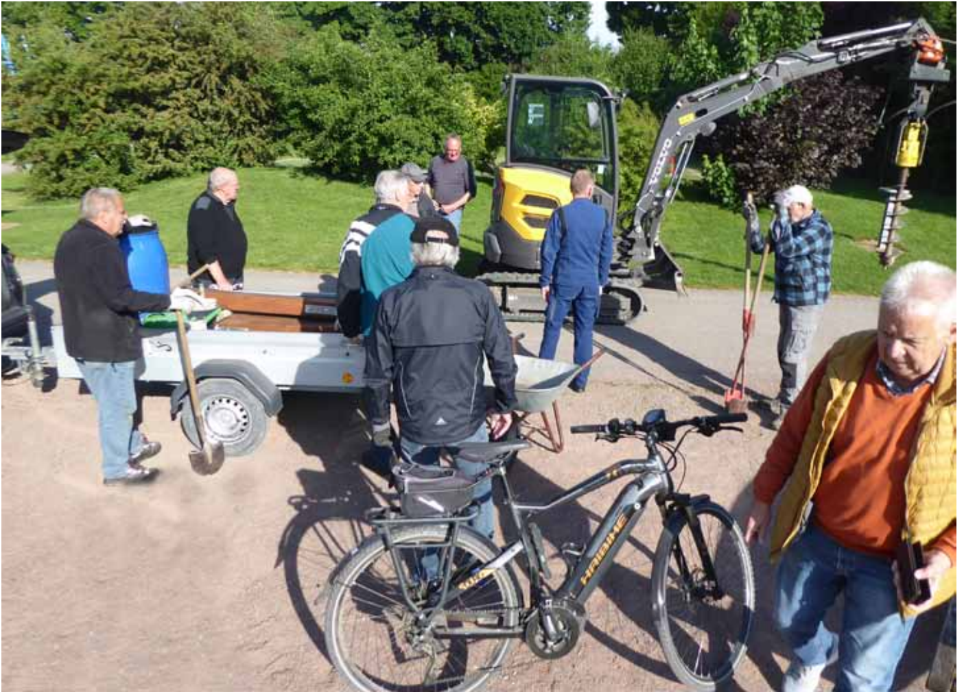
Die Mannschaft steht bereit.