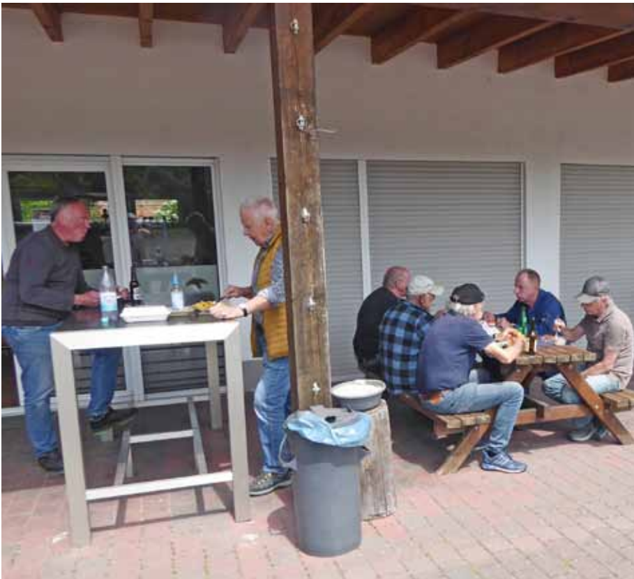
Auch eine Pause muss sein.

Eine Woche vor der Eröffnung war es dann soweit: Ein Bagger mit aufgesetztem Bohrer wurde gemietet, alle benötigten Werkzeuge und Materialien wurden auf einen Anhänger geladen und dann Station für Station abgefahren, um die Stelen zu stellen. Ein ganzer Tag waren wir mit der Gerätschaft unterwegs, doch am Ende des Tages war es geschafft, die Stelen standen einbetoniert jeweils an ihren vorgesehenen Plätzen.