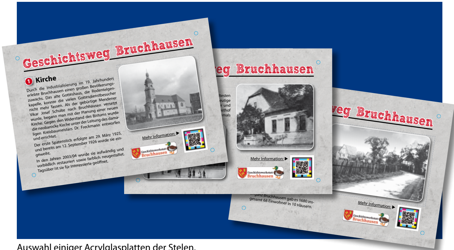
Auswahl einiger Acrylglasplatten der Stelen.

Schwierig wurde es bei der Erstellung der Texte, die mit dem QR-Code verknüpft werden sollten. Zahlreiche Recherchen und Korrekturläufe waren nötig bis die finale Version abgespeichert war. Von unserem Administrator wurden alle dazugehörigen Dateien ins Netz hochgeladen. Zusätzlich wurden speziell für Sehbehinderte sämtliche Texte eingesprochen und als mp3-Datei abgespeichert und ebenfalls mit dem QR-Code verknüpft.